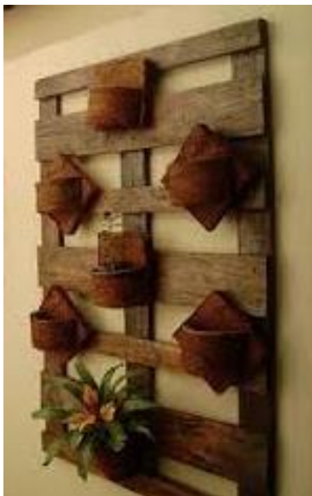
Figura 9 – Foto de um exemplo de Jardim vertical com madeira de demolição