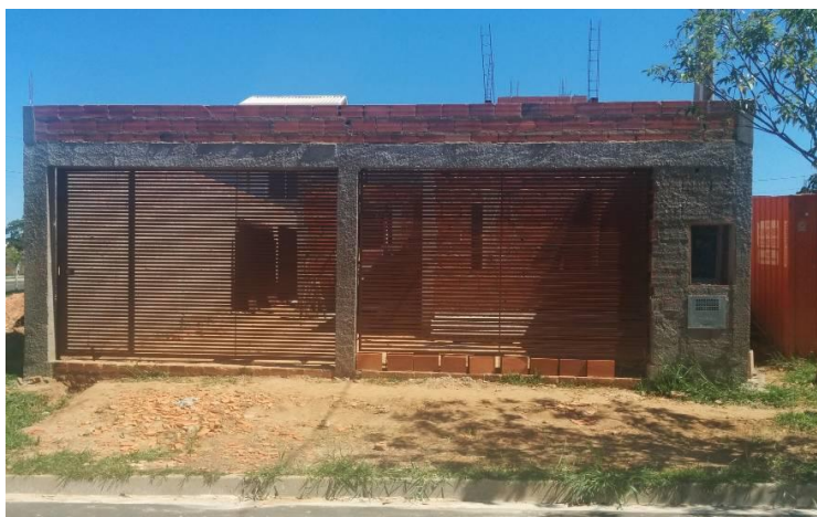
Figura – Foto da casa Nº 15 no Jardim Ibirapuera – 20/11/2016 (22°54'52.2"S 47°07'02.2"W; -22.914492, -47.117277)