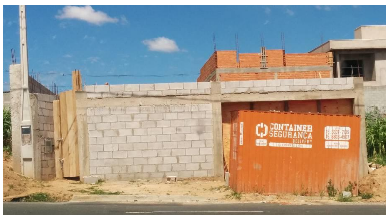
Figura 8 – Foto da casa Nº 10 no Parque Fazenda – 06/11/2016 (22°55'48.4"S 47°07'06.2"W; -22.930107, -47.118397)