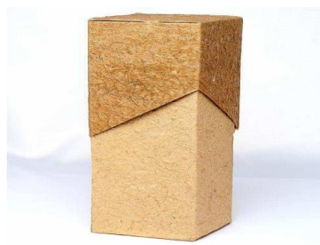
Figura 10 – Exemplo de uma Caixa de papel kraft reciclado

Atualmente existem diversas maneiras de reciclar e reaproveitar qualquer tipo de papel e não seria diferente com o kraft. Devido a suas características diferenciadas, alguns recicladores utilizam-no para fazer caixas, capas de caderno e vários outros itens de artesanato. O processo utilizado é bastante simples, depois de ser separado, lavado e triturado, ele é colocado em um molde e vai para secagem, após secar o papel pode ser moldado. A figura 10 mostra uma caixa feita com o papel reciclado.