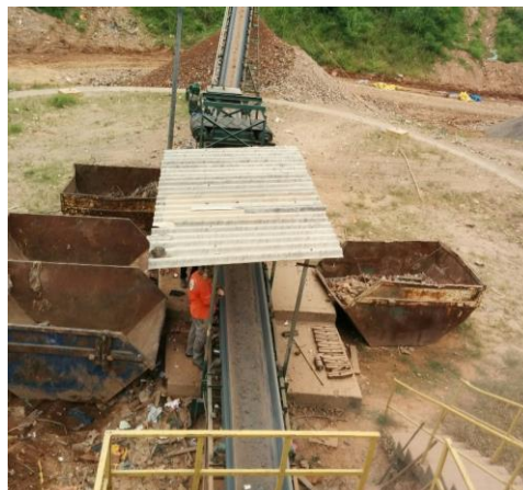
Figura 3 – Foto do processo de separação pós trituração, Unidade recicladora de materiais, Campinas, São Paulo (22°55'28.1"S 47°08'40.1"W; -22.924477, -47.144465)

Quando o acumulo é grande o triturador é ligado. A retroscavadeira transfere os materiais do monte para entrada da máquina de tritar. Nesse primeiro momento há uma separação mais superficial. Um funcionário remove alguns itens mais fáceis de serem separados e os separa, porém, a grande parte entra no triturador. Existe também um operador que controla a máquina, ligando e desligando conforme os resíduos são transferidos. Na entrada do triturador há uma peneira que permite a passagem de alguns pedaços de materiais mais pequenos, esses pedaços menores caem em uma esteira e são levados para um monte diferente pois os agregados com granulometria menores têm funções diferente daqueles mais grossos. Assim que os materiais passam pelo motor principal, os pedaços caem em uma esteira. Ao longo dessa esteira ficam algumas pessoas recolhendo material que não servem para virar brita, como por exemplo: ferro, resíduo orgânico, tecido, madeira, tubos de pvc entre outros (Figura 3).