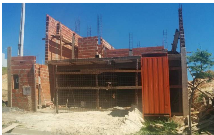
Figura 6 – Foto da casa Nº 111 no Jardim Ibirapuera – 20/11/2016 (22°55'06.7"S 47°07'04.2"W; -22.918529, -47.117833)

Até o dia 12/03/2017 (última visita registrada) foram realizadas vinte e cinco visitas aos canteiros de obras. Infelizmente no dia 06/11/2016 a obra da casa nº 10 localizada no bairro parque fazenda foi totalmente fechada, dificultando o levantamento dos dados. Então a partir desta data não foram realizadas mais visitas a esta obra, porém os dados coletados anteriormente serão mantidos e foram considerados nas análises. A seguir estão as imagens na figura 6, 7 e 8, de cada residência em seu estágio atual.