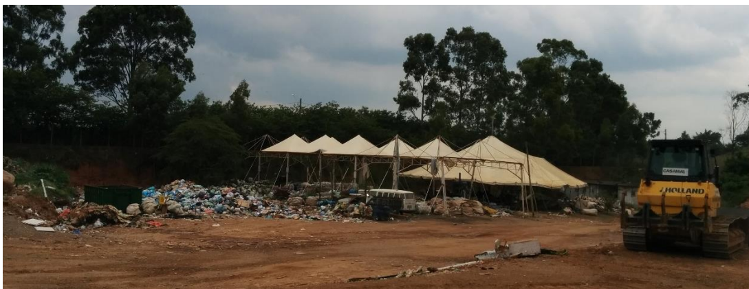
Figura 4 – Foto dos - Resíduos recicláveis separados pela cooperativa Tatuapé, Unidade recicladora de materiais, Campinas, São Paulo (22°55'28.1"S 47°08'40.1"W; -22.924477, -47.144465)

Dentro da U.R.M. tem uma parte destinada à uma cooperativa de reciclagem chamada Tatuapé. Todo material que é separado no processo e que pode ser reciclado, é coletado pelos funcionários da cooperativa, que por sua vez vendem estes materiais e desta forma geram renda para sobreviverem. Além do que é coletado do RCC a prefeitura entrega uma quantidade de resíduos recicláveis para ajudar a cooperativa. No dia da visita foi registrado uma imagem (Figura 4) do local onde os funcionários deixam os resíduos separados para vender.