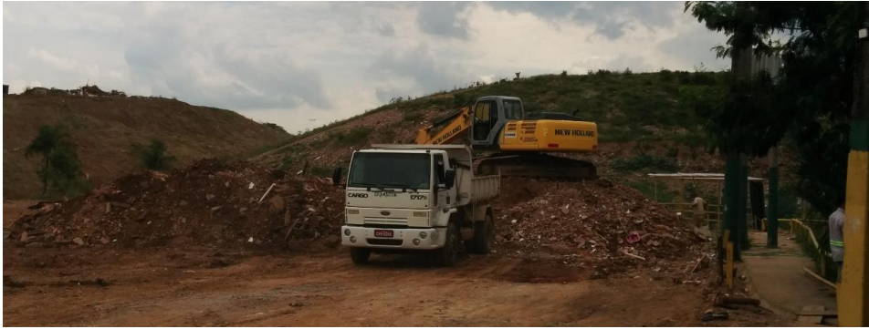
Figura 2 – Foto do Início do processo de trituração dos resíduos, Unidade recicladora de materiais, Campinas, São Paulo (22°55'28.1"S 47°08'40.1"W; -22.924477, -47.144465) (Fonte: Próprio autor (2017))

A grande parte das caçambas, são descarregadas com materiais diversos misturados e o mesmo são colocados em um monte para serem triturados (Figura 2).